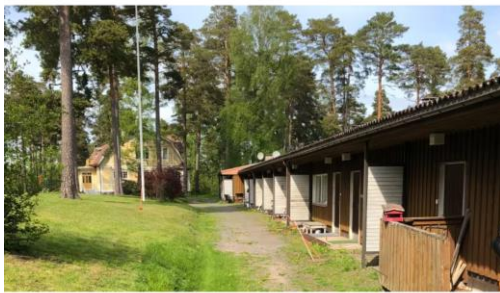
På det här området, intill det gula biblioteket i Bromarv, vill ett bolag bygga nya bostäder. Arkivbild.

Publicerad 09:10 2023 05:39 Uppdaterad 09:10 2023 10:16