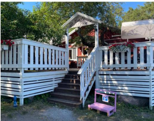
Restaurang Bystrands musikkvällar bjöd upp till en politisk dans då granne klagade över för ljudig musik.