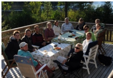
Ma-fy-ke-bi-ge i naturen tillsammans 5.9