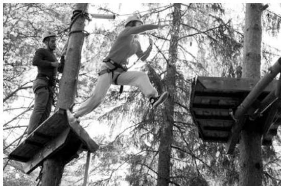
Äventyrsbanan på Klippan stärker gruppernas sammanhållning och uppmuntrar till samarbete. Ett par dagar utanför skolmiljö ger inspiration och nytänk inför slutproduktionerna.

UFFBOM var med och arrangerade och gav understöd till en tvådagars workshop på Klippan i Munsala för årets bild- och musikteor. De två dagarna blev en god start på tredje året och en fin förberedelse för arbetet med respektive linjers slutarbeten.