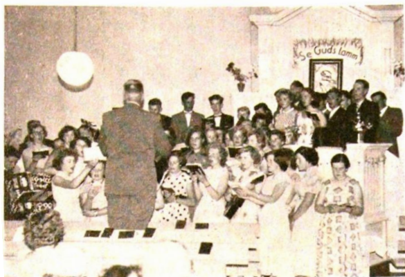
Strängbandet, som sjöng vid Missions - Ungdomslägret i Jeppo den 7—11/8 1957.